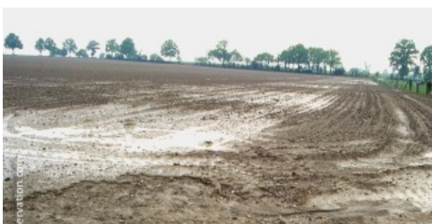
Sol nu, travaillé = sol mort

Dans un sol sain et vivant, poussent des plantes saines et robustes.