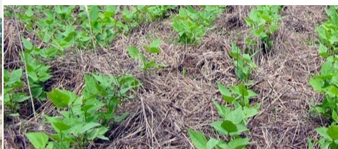
Sol couvert donc protégé bien nourri = sol vivant et sain